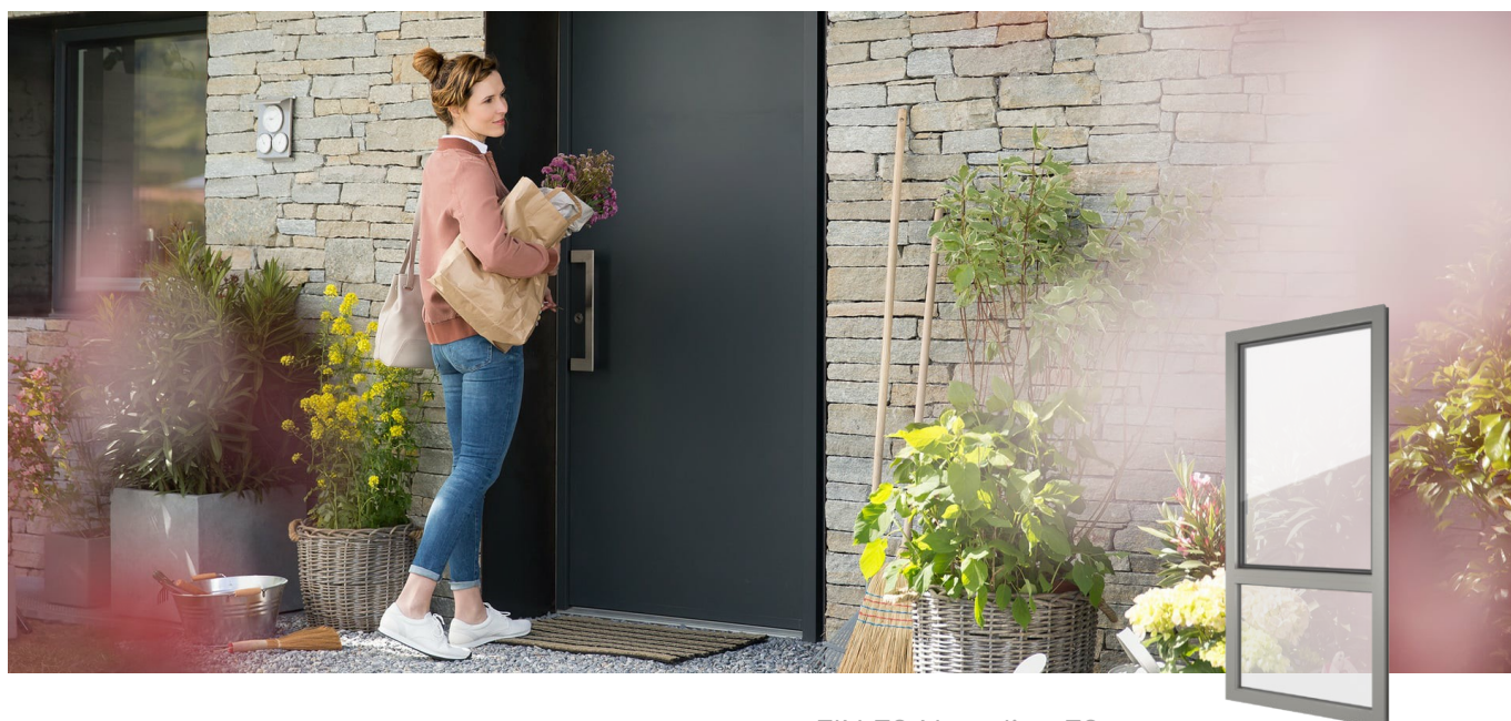
FIN-72 Nova-line 72 Kunststof-Kunststof