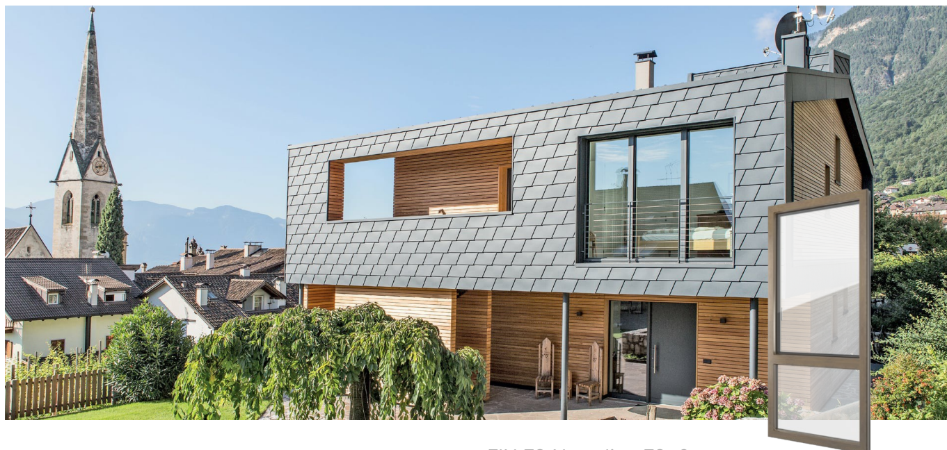
FIN-72 Nova-line 72+8 Alumínio-PVC