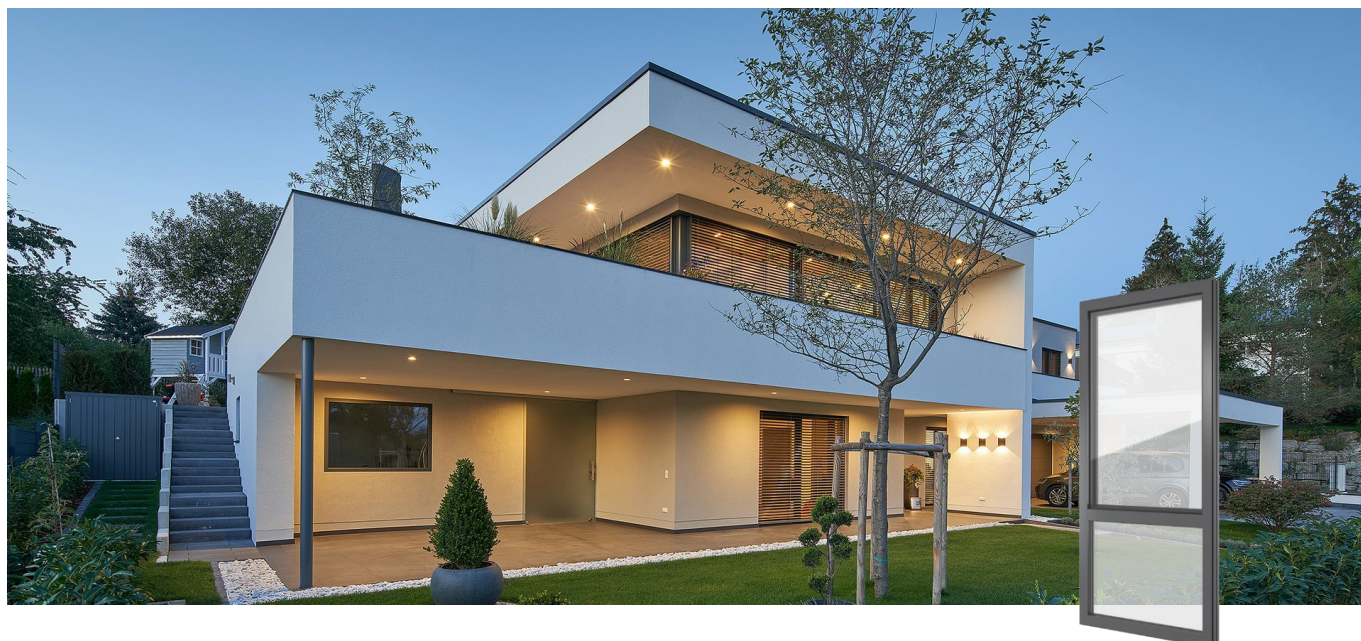
FIN-Project Nova-line 78/88 alluminio-alluminio