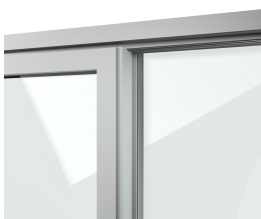
Figura: portas de correr elevadora de uma folha, exterior em alumínio cinza umbra F722 e interior em PVC cinza 06