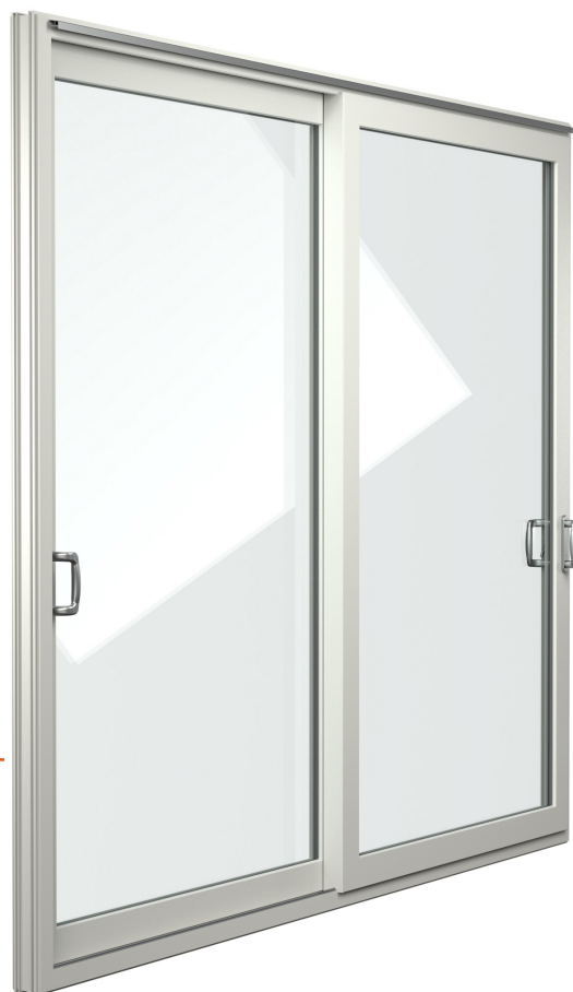
Schuifdeur FIN-ScrollLight in tweevleugelige uitvoering, buiten en binnen kunststof Wit gesatineerd 45