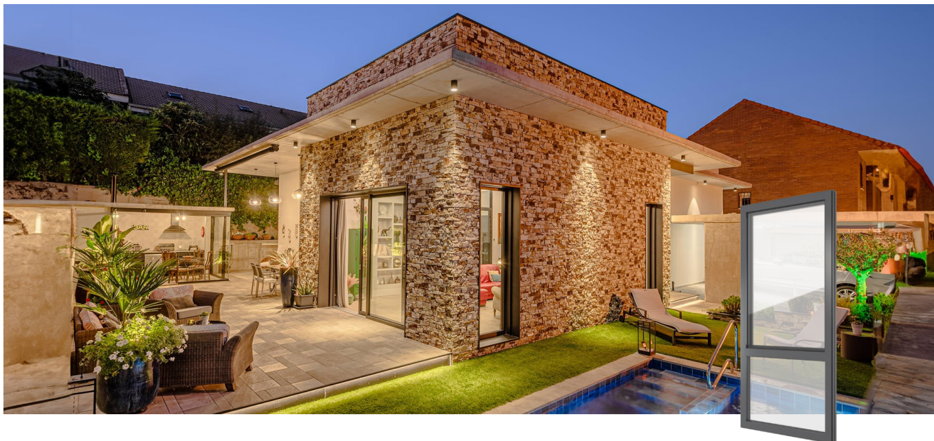
FIN-Project Nova-line 78/88 Aluminium-aluminium