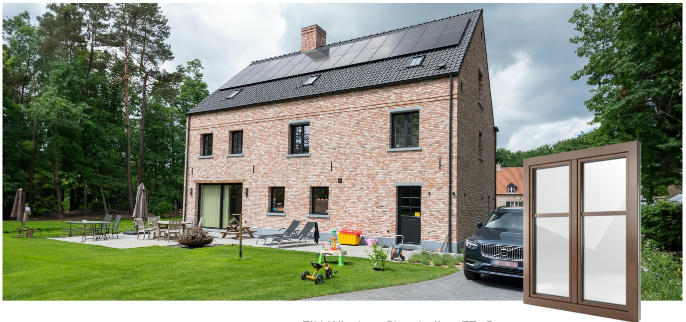
FIN-Window Classic-line 77+8 Aluminium-PVC