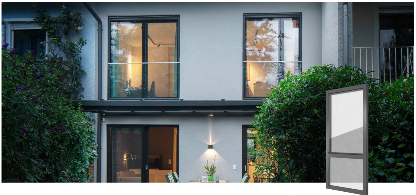
FIN-Project Nova-line 78/88 Aluminium-Aluminium